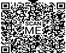
แบบประเมินความคิดเห็น (HR Newsletter)